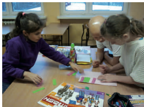
Nauka w grupach

twórczą, świadomość kulturalną i zdolności sportowe (koszykówka, szachy, tenis stołowy); z doradcą zawodowym w celu aktywizowania uczniów do podejmowania samodzielnych decyzji edukacyjno-zawodowych (dla uczniów klas VI).