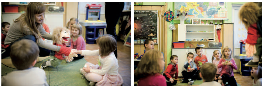
Zajęcia z pacynką Inny