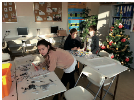
Praca nad projektem

W toku działania dostrzeżono, że do podwyższenia rezultatów uczenia się oraz efektywności pracy uczniów przyczyniła się niewątpliwie stosowana strategia pracy – kooperatywne uczenie się, które wymagało małej liczby dzieci w grupie oraz aktywnych metod. Prowadzący zajęcia, na podstawie autorskich programów i scenariuszy, poprzez wyzwalanie uzdolnień i możliwości tkwiących w uczestnikach projektu, także tych o specjalnych potrzebach edukacyjnych, stwarzali przestrzeń do osiągnięcia i doświadczania sukcesów. Ponieważ dobra szkoła wyrównuje szanse edukacyjne uczniów dzięki temu, że umacnia ich aktywność i samodzielność, stąd praca na zajęciach oparta była również na metodzie projektu. Stosowana strategia oraz metody pracy umożliwiały uczniom wspólną pracę nad różnymi zadaniami, wspieranie się i rozwijanie kompetencji kluczowych. Wzbudzało to w dzieciach potrzebę okazywania szacunku innym oraz potrzebę tolerancji dla odmiennych poglądów czy postaw.