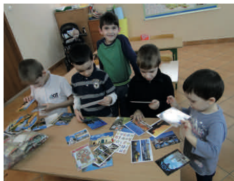
Tworzenie pocztówek z wakacji

z Ośrodkiem Pobytowym dla Cudzoziemców w Białymstoku. W trakcie zajęć szczególny akcent został położony na wybrane zagadnienia dotyczące polskiej kultury i realiów życia w Polsce. Bardzo ważne były również kwestie dotyczące innych kultur i rzeczywistości społecznych, ze szczególnym uwzględnieniem kultur pochodzenia uczestników zajęć. Należały do nich: sposoby witania się i normy grzecznościowe; święta i uroczystości rodzinne, religijne i narodowe; dom jako miejsce i przestrzeń najbliższa; rola i znaczenie szkoły w życiu dziecka; tradycyjne dania z różnych stron świata; różne aspekty podróży bliskich i dalekich; elementy historii lokalnej; symbole narodowe. Treści programowe były realizowane za pomocą aktywizujących metod pracy, które umożliwiły dzieciom korzystanie z ich potencjału twórczego oraz utwierdzały w przekonaniu, że są w stanie wiele osiągnąć w zakresie edukacji.