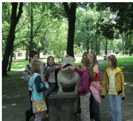
Poznanie dziedzictwa kulturowego Białegostoku