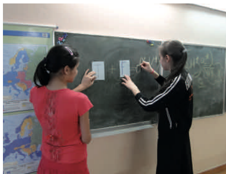
Aktywne zadania gwarantujące sukces

Działanie, ze względu na zastosowanie metody międzykulturowego portfolio, cieszyło się dużym zainteresowaniem dzieci. Cudzoziemcy z chęcią uczęszczali na zajęcia i z zaangażowaniem wykonywali zadania językowe i plastyczne. Po zakończeniu pilotażu projektu dostrzegłyśmy znaczny wzrost umiejętności komunikacyjnych dzieci oraz ich motywacji do nauki języka polskiego. Wskazywała na to także ewaluacja dokonana w ramach podsumowania zajęć. Obecnie działanie prowadzone jest na terenie polskich szkół, jak i innych placówek zajmujących się edukacją formalną i pozaformalną.