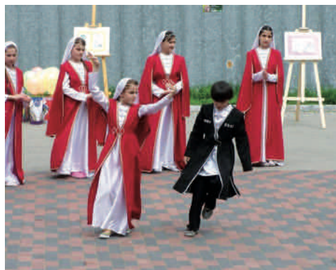
Obchody Światowego Dnia Uchodźcy

które obejmowały warsztaty tańca czeczeńskiego, warsztaty kulinarne oraz wycieczkę śladami dziedzictwa kulturowego Białegostoku.