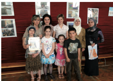
Podczas podsumowania konkursu